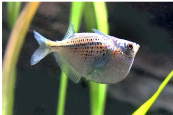
Gasteropelecus maculatus STEINDACHNER 1879, Familie Gasteropelecidae BLEEKER 1859