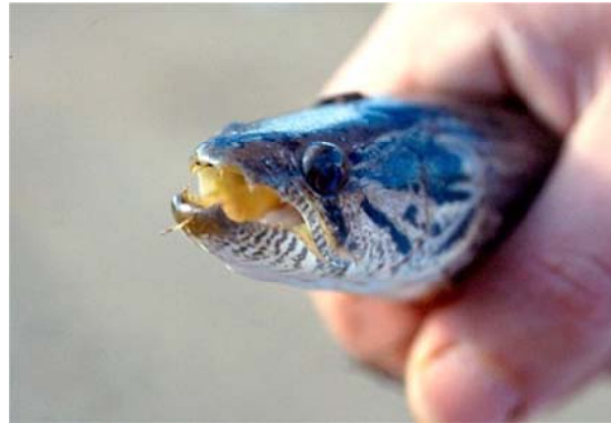
Hoplias malabaricus (BLOCH 1795), Familie Erythrinidae RICHARDSON 1856