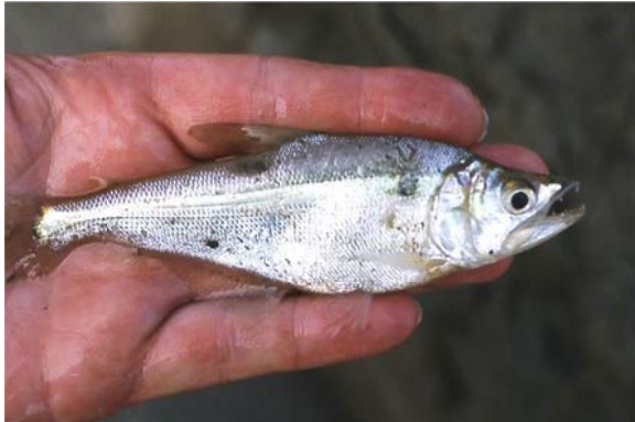
Galeocharax gulo (COPE 1879), Familie Characidae LATRELLE 1825