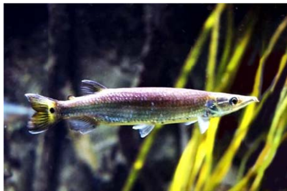
Ctenolucius hujeta (VALENCIENNES 1859), Familie Ctenoluciidae SCHULTZ 1944