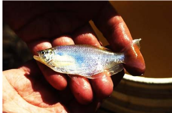
Paragoniates alburnus STEINDACHNER 1876, Familie Characidae LATRELLE 1825