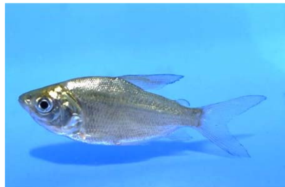
Potamorhina altamazonica COPE 1858, Familie Curimatidae GILL 1858

Wie schon zum Vereinsabend am 17.03. des Jahres ausgeführt, ist die Vielfalt der Ordnung Characiformes mit 23 amerikanischen Familien, 246 Gattungen und 2126 Arten (Stand 2025) so groß, dass deren Vorstellung mehrere Vortragsabende erfordert.