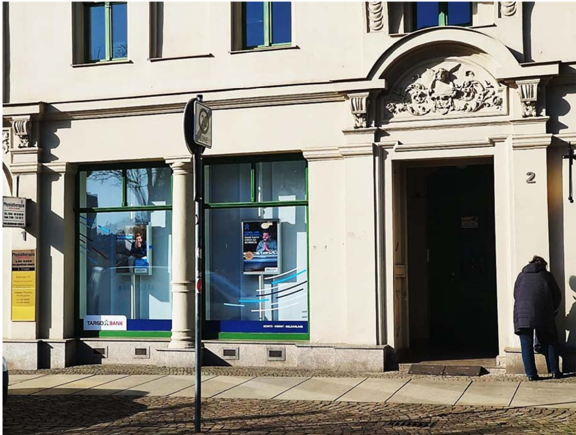
Heutige Ansicht des Geschäftes in der Talamtstraße 2