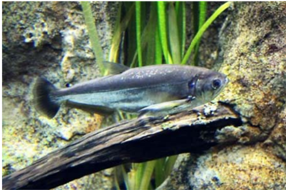
Hydrolycus scomberoides (CUVIER 1819), Familie Cynodontidae EIGENMANN 1907

Ctenoluciidae (amerikan. Hechtsalmmler), Curimatidae (Breitlingsalmmler), Cynodontidae (Wolfssalmmler), Erythrinidae (Raubsalmmler), Gasteropelecidae (Beilbauchsalmmler), Hemiodontidae (Keulensalmmler), Iguanodectidae (EidechSENSalmmler) und Lebiasinidae (Schlanksalmmler) beispielhaft vorgestellt werden.