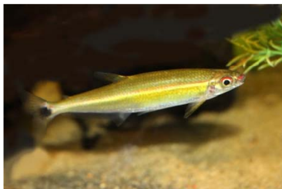
Iguanodectes adujay GERÝ 1970, Familie Iguanodectidae EIGENMANN 1909