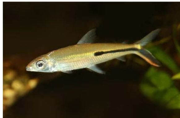
Hemiodus semitaeniatus KNER 1858, Familie Hemiodontidae BLEEKER 1859