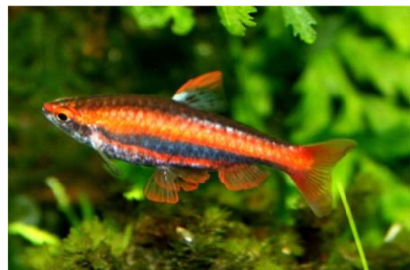
Nannostomus mortenthaleri PAEPKE & ARENDT 2001, Familie Lebiasinidae GILL 1893