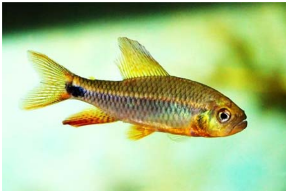
Crenuchus spilurus GÜNTHER 1863, Familie Crenuchidae GÜNTHER, 1863