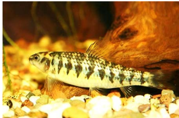
Characidium pterostictum GOMES 1947, Familie Crenuchidae GÜNTHER, 1863